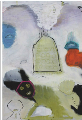
Charlotte Tønder: Polar going Wild, 60x80.

I bogen stiller han spørgsmålet 'kan man lære at være gammel?' Asger Baunshak-Jensen siger selv: 'Jeg spænder over flere livsalde. Jeg nyder erindringer om en tid, der ikke er mere; men jeg ser med nys-